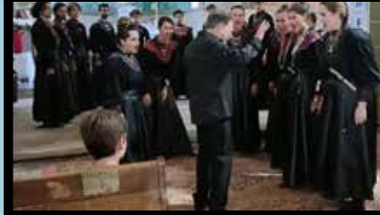
Le chœur Mikrokosmos a envoûté le public