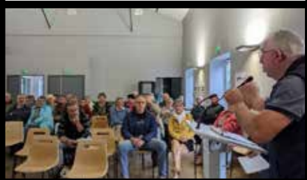
Rencontre avec les habitants