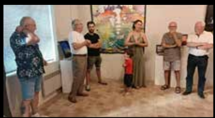
Carolalune au musée de l'Ocre