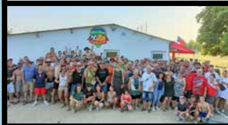
La JSM a célébré ses 50 ans