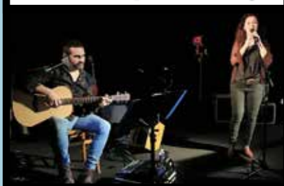
Soirée réussie pour la Montagne