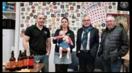
La brasserie L'Aouf cherche à se développer