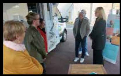
Dans le bus France services