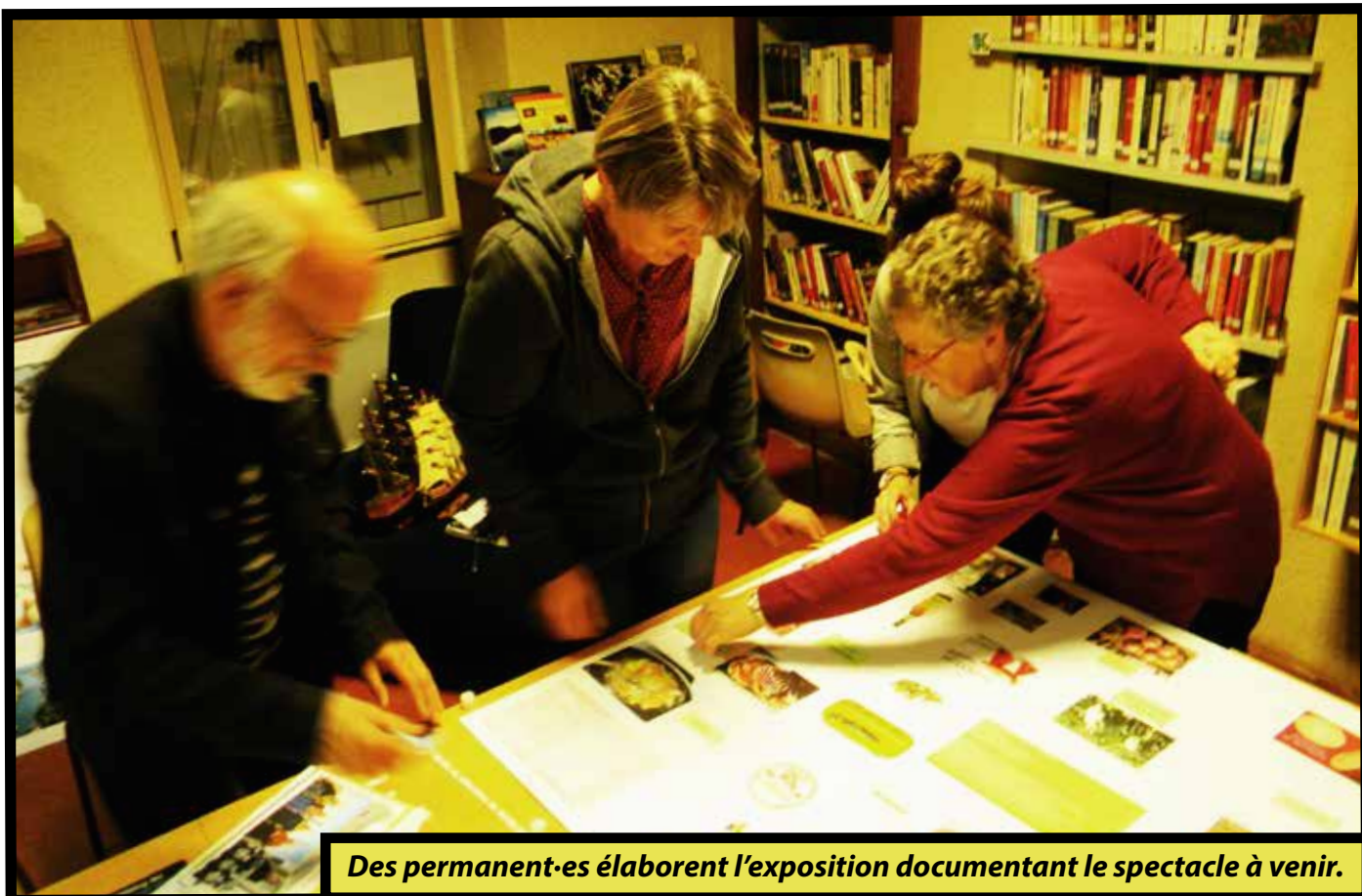
Des permanent-es élaborent l'exposition documentant le spectacle à venir.

N'hésitez pas : au-delà des activités proposées, vous y trouverez un large éventail de romans dont certains en large écriture, de nombreux livres pour enfants, une grande partie des livres nouvellement sortis, mais aussi des bandes dessinées et des mangas pour les ados, des jeux et des DVD !